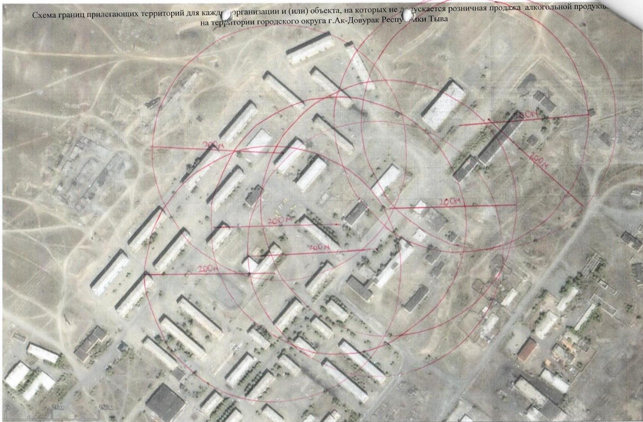
Схема границ прилегающих территорий для каждой организации и (или) объекта, на которых не допускается розничная продажа алкогольной продукции, на территории городского округа г.Ак-Довурак Республики Тыва